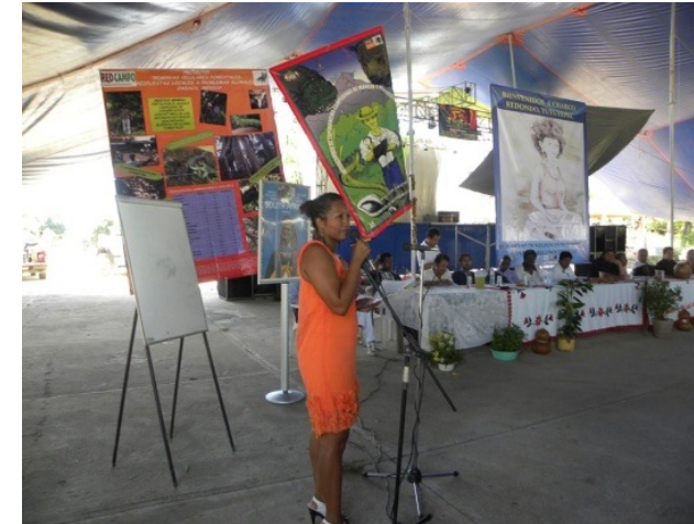
XII Encuentro de pueblos negros en Charco Redondo, Tututepec, Oax. 2011