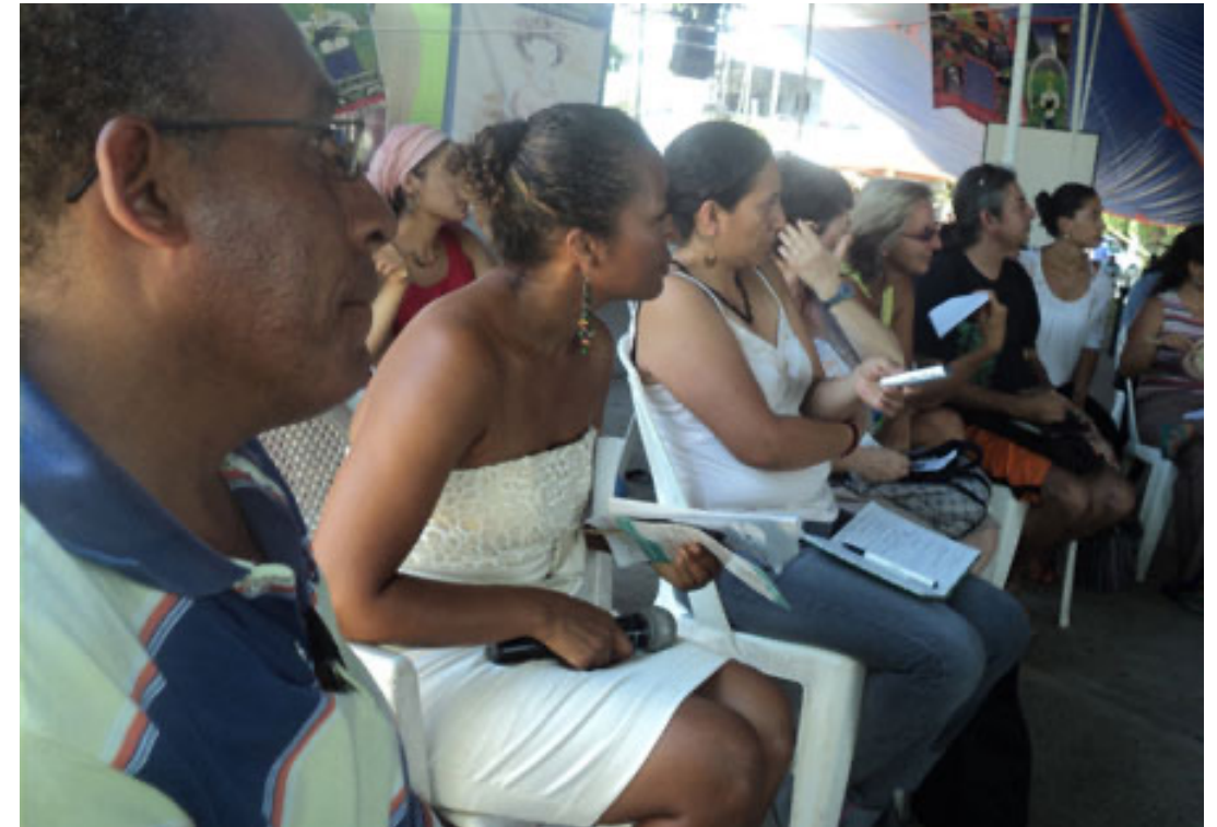
XII Encuentro de pueblos negros en Charco Redondo, Tututepec, Oax. 2011

El XI Encuentro de pueblos negros en el 2011, fue un ito para algunas mujeres negras.